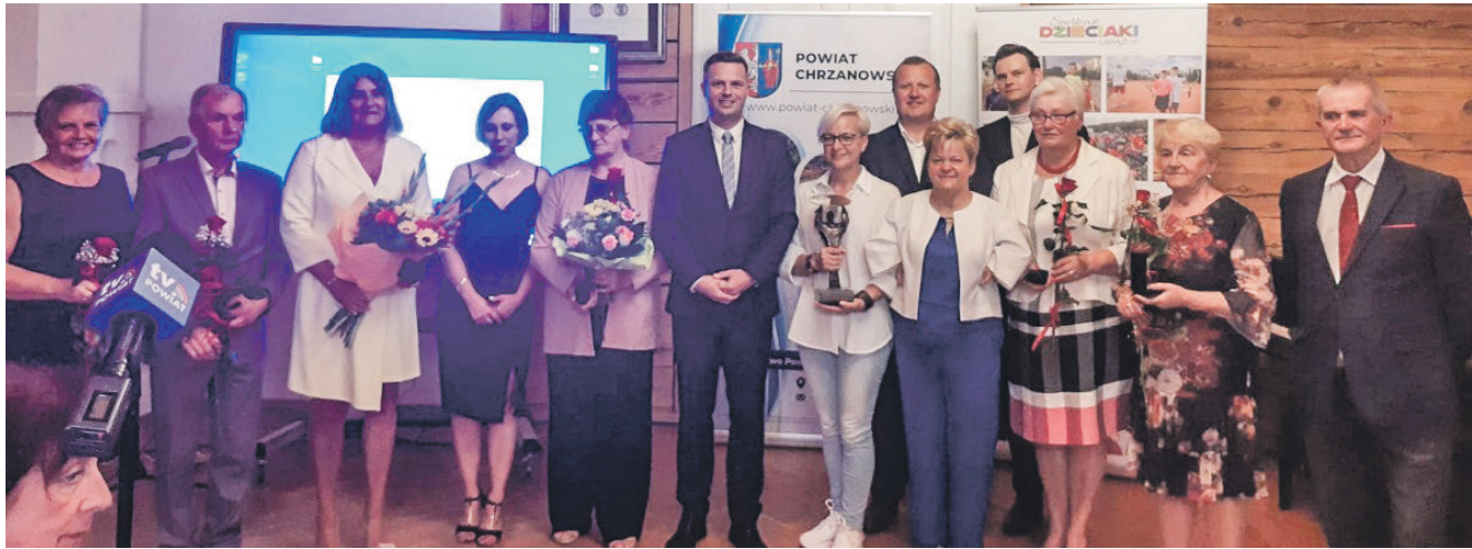
XII Forum NGO w 2023 roku

Spotkamy się podczas XIII Powiatowego Forum Organizacji Pozarządowych. Zapraszamy do Wygietzowa.